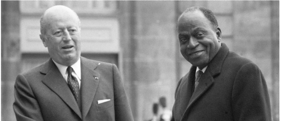
Foccart & Houphouët-Boigny, les pères fondateurs de la francophonie